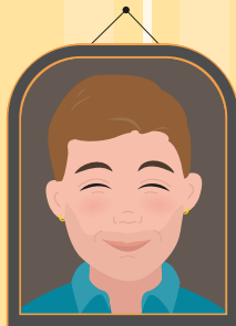
Markus barnens lärare